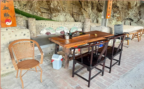
Table à thé

Oui ! Au deuxième étage, nous avons un espace commun : Imaginez-le comme la version Netflix de l'école, mais avec plus de thé et moins de visionnage compulsif.